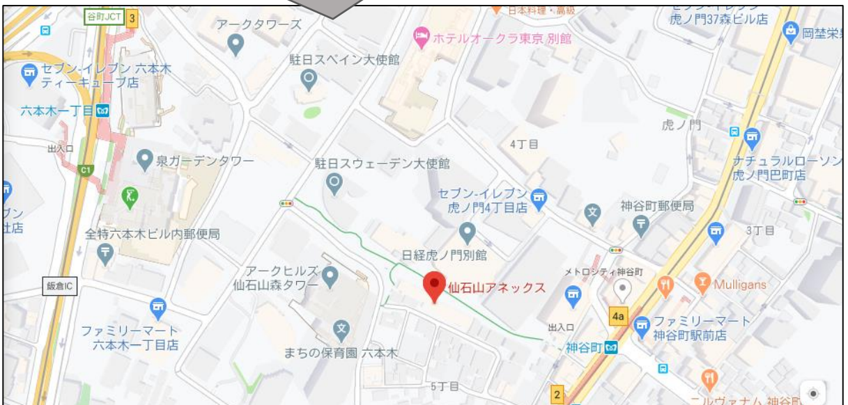
(地図: Google Mapsより)